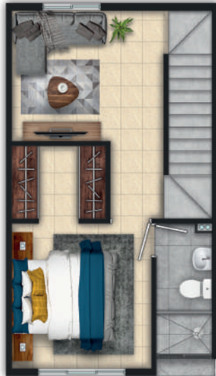
02 PISO - 32 m 2