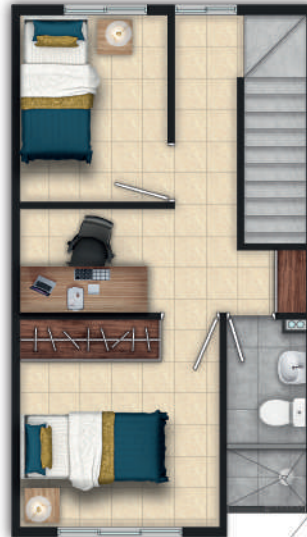
03 PISO - 32 m 2